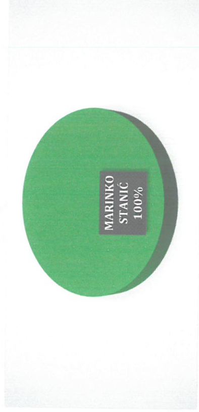
Vlasnička struktura prije i nakon mjera restrukturiranja

Tvrtka SIMTRADE GRADNJA d.o.o. je 100% vlasništvu Marinka Stanića. Nakon restrukturiranja vlasnička struktura tvrtke neće se mijenjati. U nastavku se nalazi grafički prikaz vlasničke strukture prije i nakon mjera restrukturiranja.